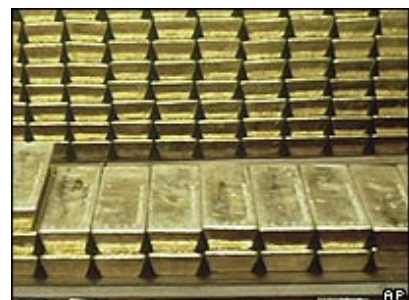
La mina es la más grande de su tipo en América Latina.

Según lo acordado, los campesinos levantarán este miércoles el bloqueo de la ruta que une Cajamarca y Bambamarca, mientras que la mina reanudará sus operaciones inmediatamente.